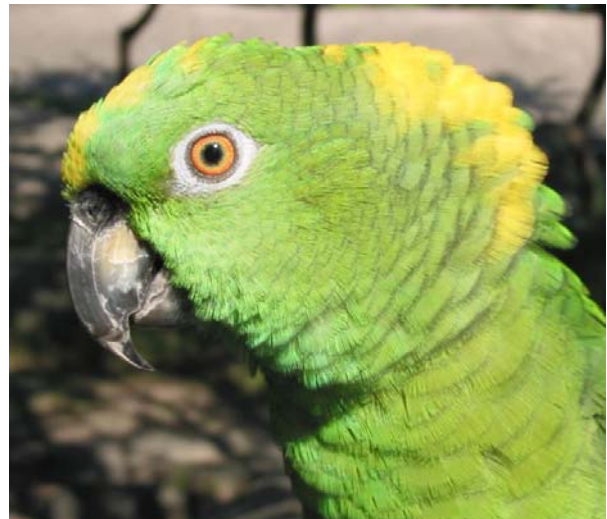
Keltaniska-amatsoni ( A. o. auropalliata )