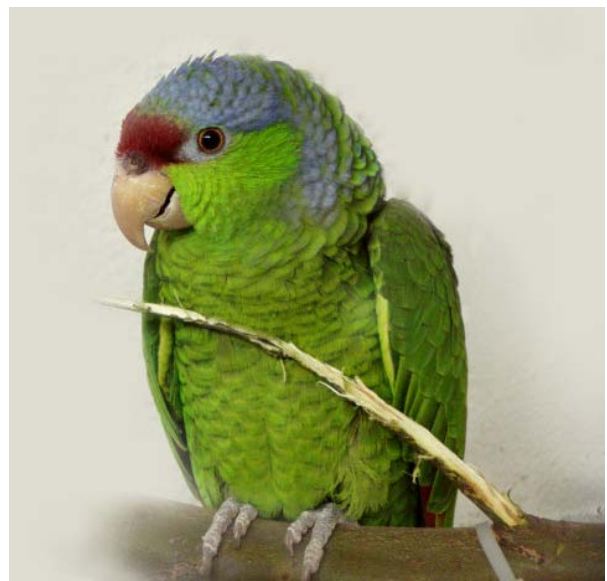
Lila-amatsoni ( A. finschi )