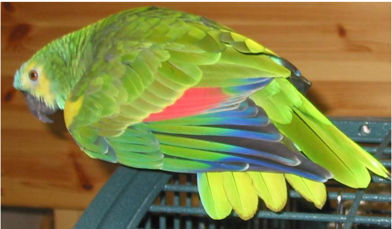
Siniotsa-amatsoni kosiskelee esittelemällä siipien ja pyrstön väriloistoa.

Matkustelu ja ulkoilu avartavat myös linnun maailmaa ja tuovat samalla uusia kokemuksia omistajalle. Ulkoiluttaminen tapahtuu joko häkissä tai sitten papukaijoille tarkoitetuissa valjaissa. Jalkarenkaaseen ei missään nimessä kannata narua laittaa, koska linnun pelästyessä ensimmäisenä antaa periksi linnun jalka ennen narua. Vaikka siivet olisi tyhistetty, niin vapaana pitämistä ulkona ei voi suositella, koska lintu saattaa silti päästä varsin kauas, esimerkiksi auton alle.