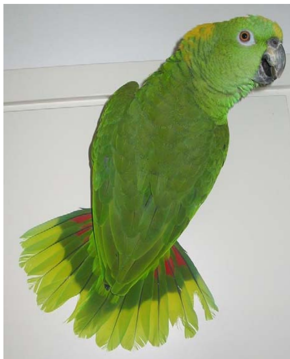
Pesintäaikana amatsonista saattaa tulla varsinainen kuumakalle. Kuvassa uhoaa keltaniska-amatsoni ( Amazona ochrocephala auropalliata ).

Nämä eivät todellakaan ole ns. häkkilintuja, vaikkakin häkin olemassaolo on varsin suotavaa, koska tällöin lintu pääsee halutesaan rauhoittumaan, turvaan ja nukkumaan