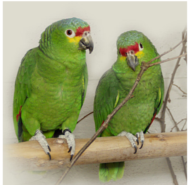
Punaotsa-amatsoneja (A. autumnalis)

Käsikesyn poikasen hinta vaihtelee 1000-2500 euroon, lisäksi toinen merkittävä kulu tulee häkistä. Tarpeeksi kookkaat häkit maksavat n. 600 eurosta ylöspäin.