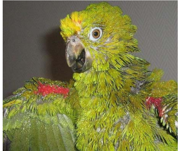
Amazonianamatsoni ( A. ochrocephala )

Lila-amatsoni on n. 32cm ja painaa 250 - 350g. Tunnetaan myös nimellä lilaotsa-