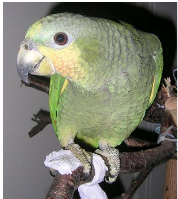
Kultaposkiamatsoni (Amazona amazonica amazonica).