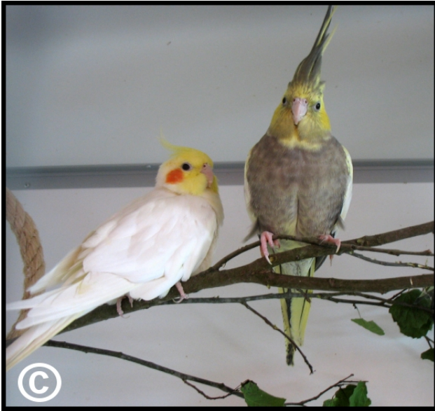
Lutino ja keltaposki-harlekiini-helmiäinen.