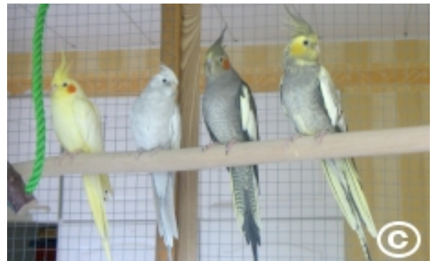
Lutino-harlekiini-helmiäinen, valkokasvo-dominoiva hopea, harmaa ja keltaposki-harlekiini-helmiäinen.

Lutino (engl. lutino) on vartaloltaan valkoinen tai vaaleankellertävä lintu, jolla on keltainen maski ja punaiset posket sukupuolesta riippumatta. Naarailla voi olla vaalean pyrstönsä alla voimakkaamman keltainen juovitus ja siipisulissa naaraille ominaiset laikut, mutta aina ne eivät ole nähtävissä tai voidaan erottaa vain valoa vasten. Lutinon silmät ovat punaiset, mutta linnun vanhentuessa ne voivat muuttua tummemmiksi. Tämä värimuoto on aina ollut yksi suosituimmista. Sitä ei kuitenkaan tule sekoittaa albiinon - kuten monet tekevät -, joka on todellisuudessa valkokasvovärystä ja lutinoa samanaikaisesti visuaalisesti ilmentävä lintu, eli valkokasvo-lutino. Kahta lutinoa ei tule yhdistää, sillä alussa lutinon jalostuksessa käytettiin niin paljon sisäsiitosta, että tuon ajan haitat yltyivät vielä tähänkin päivään, tuottaen monille linnuille esimerkiksi pienen kaljun läiskän töyhdon taakse.