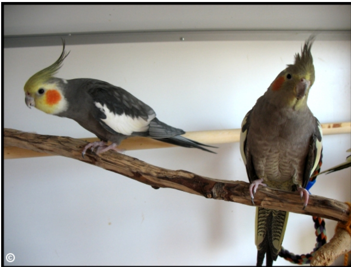
Luonnonväritteinen, eli harmaa koiras (vas) ja harmaa naaras (oik).

Australialaista alkuperää oleva neitokakadu on yksi suosituimmista lemmikkinä pidetyistä linnuista, jota voi suositella myös aloittelevalle lintuharrastajalle. Syitä sen suosioon on muun muassa miellyttävä ja veikeä luonne, kesytettävyyys, lukuisat kasvattamiseen innostaneet värimuodot, suhteellisen halpa hinta ja helppohoitoisuus suurempiin papukaijoihin nähden.