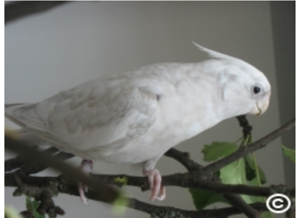
Valkokasvo-dominoiva hopea (single factor)

Dominoiva hopea (engl. dominant silver) tunnetaan myös nimellä vallitseva hopea. Nimensä mukaan tämä hopea periytyy dominoivasti, eli riittää, että vain toisella vanhemmista on hopeatekijä. Dominoivasta hopeasta esiintyy kahta erinäköistä versiota. Lintu, jolla on yksi hopeatekijä (engl. single factor), on normaalia harmaata vaaleampi, tummaraajainen lintu, jonka sulissa on marmorimainen kuviointi, jonka voimakkuus vaihtelee yksilö- ja linjakohtaisesti. Huomattavaa on, että naaraat jäävät yleensä normaalia harmaata muistuttaviksi ja niistä voi olla hyvin vaikea nähdä hopeaväriyksen olemassaoloa!. Koiraat vaalenevat jopa viidestä kuuteen vuoteen jokaisella sulkasadollaan, joten lopullisen sävyn näkeminen vie aikaa. Lintu, jolla on kaksi hopeatekijää (engl. double factor), on ikään kuin kaksin verroin yksinkertaista tekijää vaaleampi, eikä marmorointi ole yhtä voimakas. Kaksinkertaisen tekijän hopeat ovat