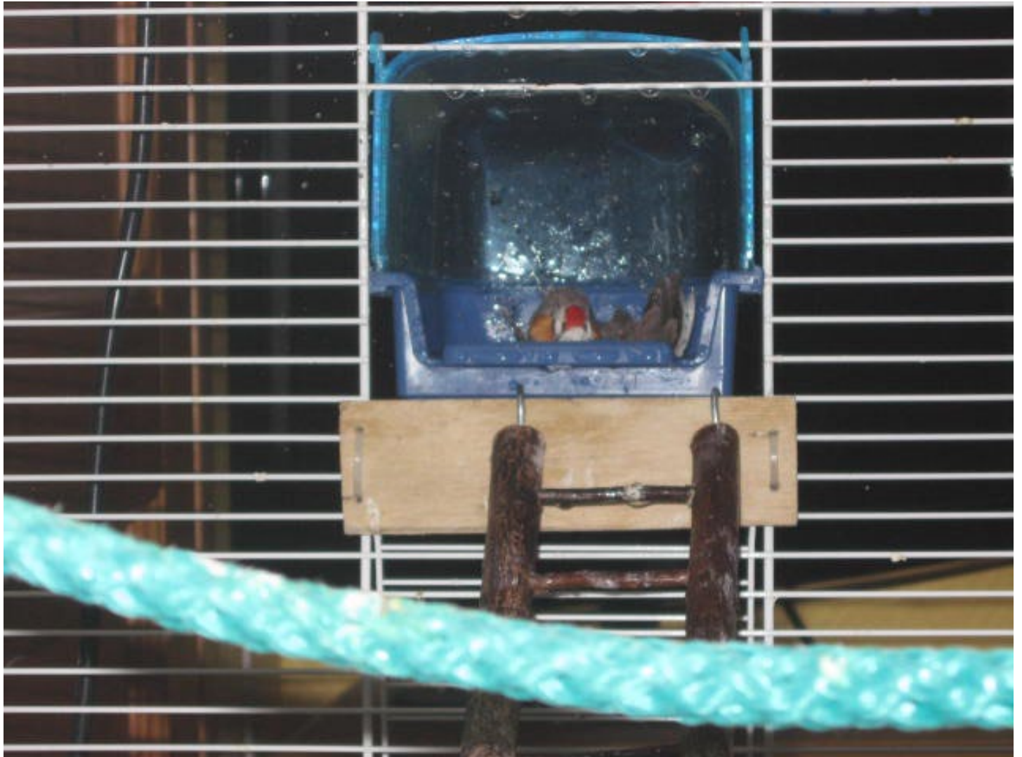
Kylpevä seeprapeippo

Haluatko oman kuvasi lukijan kuvaan? Lähetä se sähköpostilla sihteeri@kajuli.fi ja se voidaan julkaista tällä sivulla. Kuvan koon ei tarvitse olla painolaatuinen, mutta mielellään yli 800 pikseliä leveä tai korkea. Turvallisinta on kuitenkin lähettää suurempi kuva.