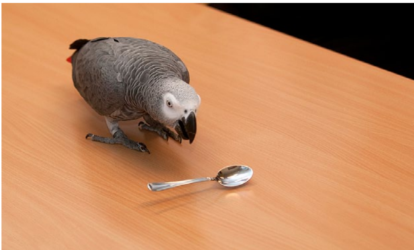
Harmaapapukaija Ukolla vaikutti olleen kova tarve saada lusikka viskattua joka kerta pöydältä alas.