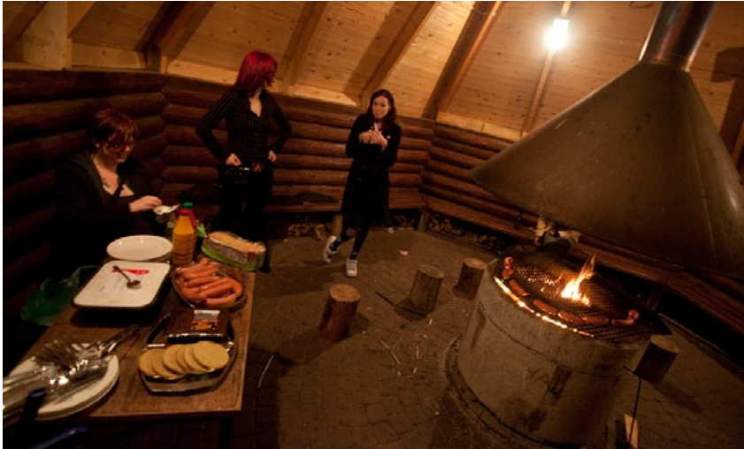
Iltaohjelmaan kuului myös grillausta keskuksen grillikatoksessa.