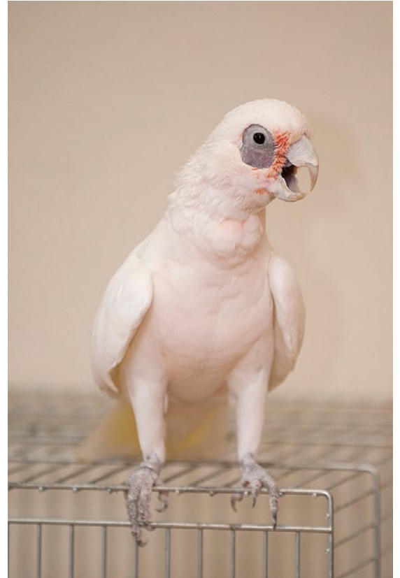
Paikalla oli myös kaksi lähdekakadua.