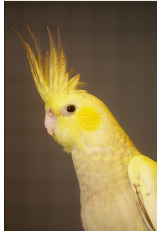
Naako on toinen vuoden 2011 aikana Ruotsista haetuista keltapuskista.

Haaveissa olisi päästä muuttamaan lähiaikoina, mutta aikataulu on vielä sen osalta hieman avoin. Kun tilanne selkenee, voin tehdä suunnitelmia seuraavalle pesintäkaudelle paremmin. Vuodelle 2013 kasvatusparieni määrä nousee toivottavasti vielä jonkin verran, eli muutoksia on tapahtumassa myös linturintamalla. Niistä en kuitenkaan vielä paljasta sen enempää. Pyrin saamaan pöntöt muutamalle pariskunnalle viimeistään kesään mennessä.