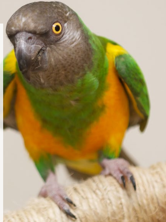
Kuvan lintu ei liity huijaustapaukseen.

Hyvin perehtymällä voi välttää huijatuksi tulemisen. Kannattaa välttää linnun ostoa ulkomailta nimenomaan netin suomalaisten myyntipalstojen kautta, ja suosia kotimaisia kasvattajia. Jos linnun haluaa ulkomailta, kannattaa kääntyä luotettavan eläinkaupan